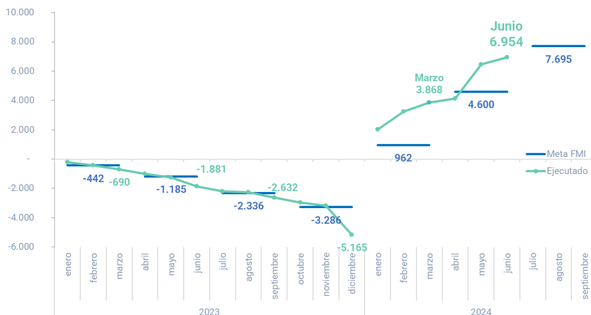
Gráfico 3. Déficit fiscal y criterios de ejecución del FMI En miles de millones de pesos corrientes. Enero 2023 – septiembre 2024